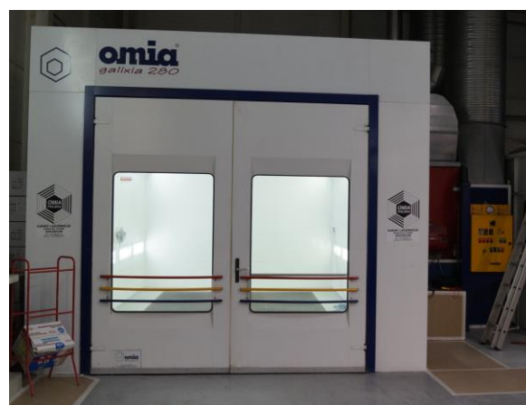
Rys. 1 kabina lakiernicza zaplanowana do rejestracji parametrów

Aby przeprowadzić rejestrację parametrów należy mieć zapewniony dostęp do obiektu rzeczywistego. Autorzy zaplanowali rejestrację w kabine lakierniczej udostępnionej przez partnera biznesowego [9]. Planowaną kabinę przedstawiono na rysunku 1.