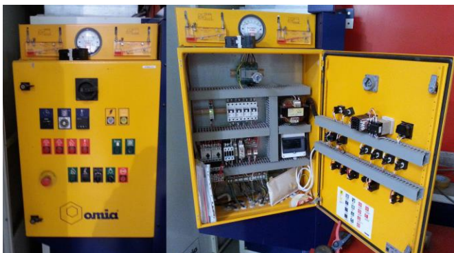
Rys. 3 Szafka sterownicza w kabinie lakierniczej zaplanowanej do rejestracji parametrów pracy

Sygnały parametrów pracy pobierane są z różnych miejsc szafki sterowniczej: lampek informacyjnych na panelu operatorskim, przekaźników i styczników. Na rysunku 3 przedstawiono wnętrze szafki sterowniczej w kabinie lakierniczej zaplanowanej do monitoringu.